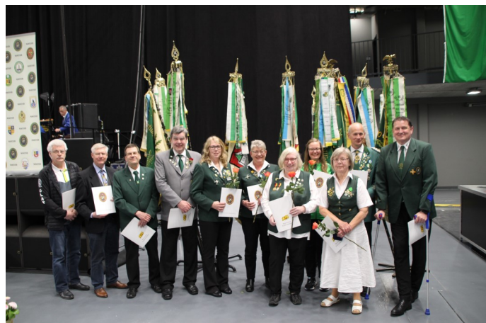
Die für besondere Verdienste geehrten Mitglieder