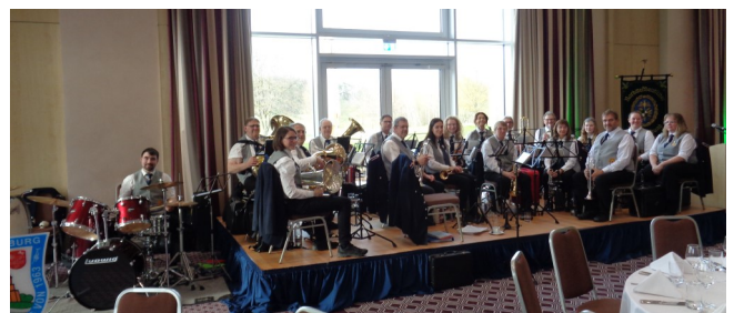
Die Kapelle der Feuerwehr Artlenburg