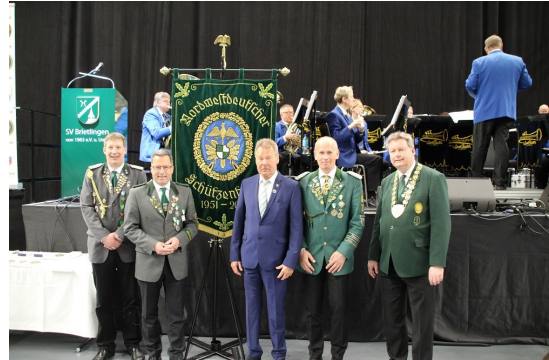
Bannerübergabe an den Bezirk Stade

Der Schützenfest 2024 sowie alle dazugehörigen Sitzungen etc.