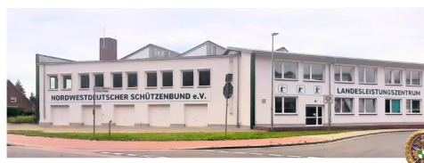
Nordwestdeutscher Schützenbund e.V. Lange Straße 68-70 | 27211 Bassum